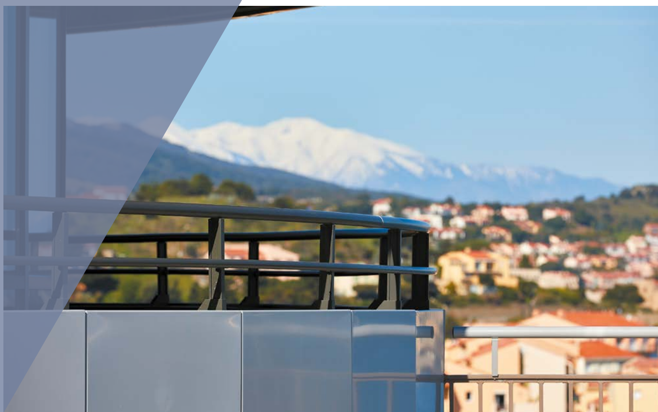
Solution TECHNAL utilisée : Garde-corps GYPSE simple poteau