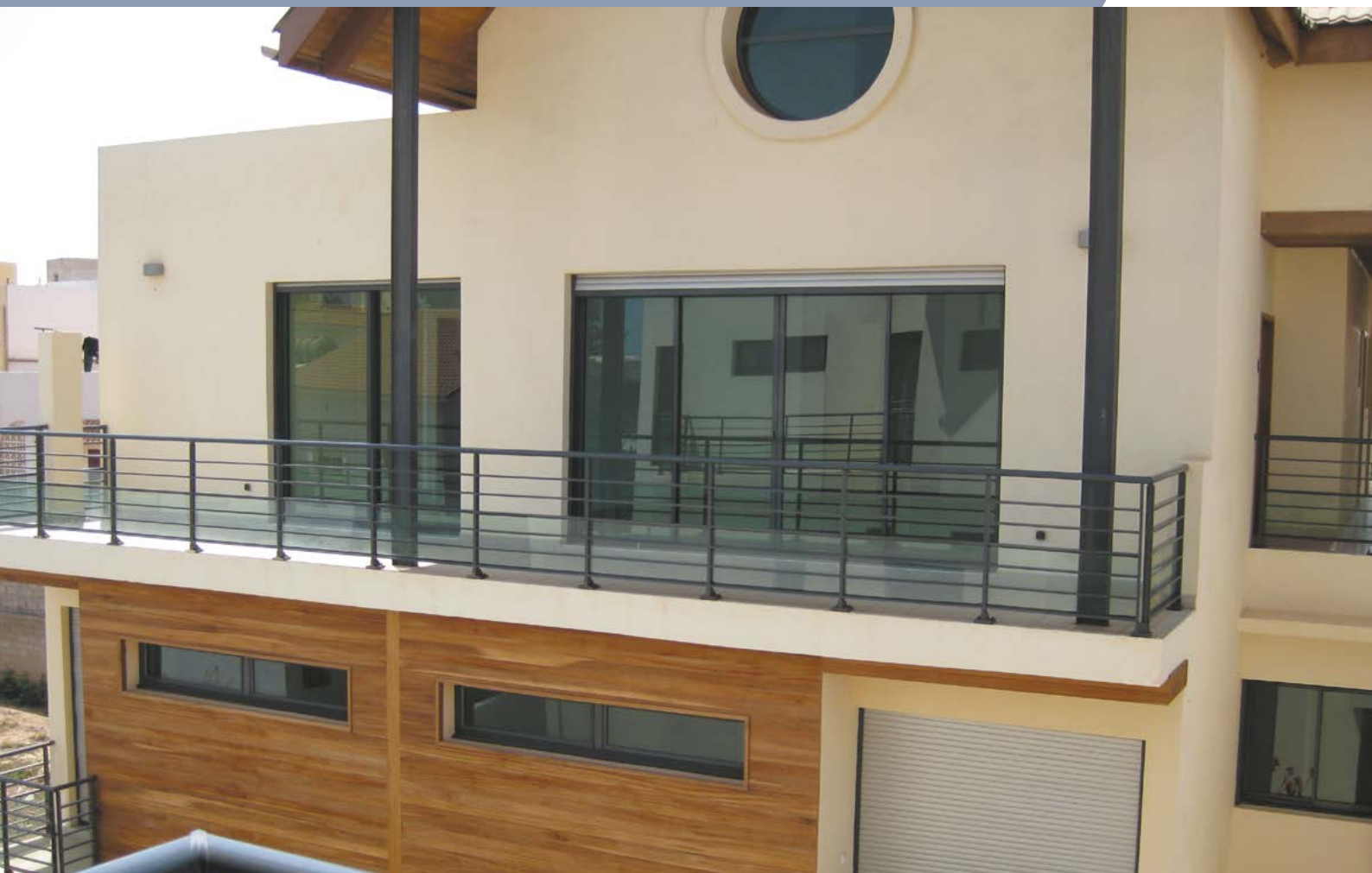
Solution TECHNAL utilisée : Garde-corps GYPSE simple poteau